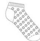
TECIDO COM VENTILAÇÃO

MALHA COM TEXTURA ESPECIAL, AJUDANDO A REGULAR A TEMPERATURA. MAIOR CONFORTO TÉRMICO